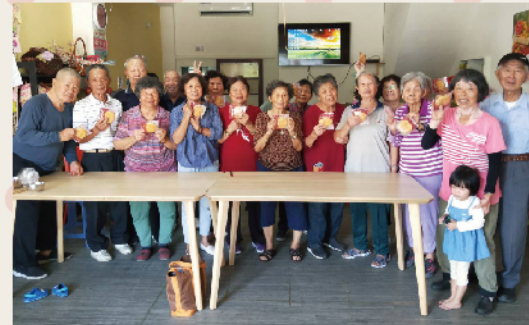
▲ 老菩薩們拿到吉祥餅樂開懷，滿心歡喜與感恩