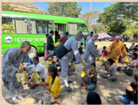
▲師父及法師發放物資給難民

12月30日師父在桑蓋縣舉辦發放物資，並且帶領大家一起念佛回向，祈願烽火早息，人民安樂。12月31日師父前往難民區關懷，逃出戰區的難民來自桑洛縣、森寶倫縣、特摩不縣、烏祖縣、瑪萊縣等多個地區，其中不乏才剛出生的小嬰兒就被母親抱在懷中逃難、身障人士、失去雙親的孤兒等等。這些難民因戰火而流離失所，每天最大的希望只是三餐溫飽，戰爭早日平息。師父不忍眾生受苦，逐一發放白米、乾糧物資，予以安撫，給予他們精神上的鼓勵安慰。