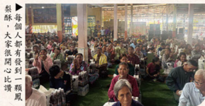
每個人都有發到一顆鳳梨酥，大家很開心比讚

此次柬埔寨福慧關懷行程，行腳遍及多個偏遠地區與難民聚集地，師父不辭辛勞，以實際行動落實佛法精神，長年如一日地付出，為當地人民帶來溫飽與希望，也讓我們深刻體會到珍惜當下、感恩擁有的重要。師父非常感恩，也讚嘆所有會員及發心者的護持，因為有大家的善心，師父才能夠代替大家將這些關懷傳遞出去。師父經常開示我們：「我們的生命有盡，色身會滅，但意識不會滅。我們每天的身口意都在造作，只是看是造善或造惡，應該要把握當下盡量去修，去做，因為只有我們實地去修，去做，才是真正自己所得。」