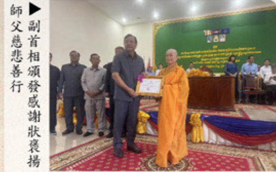
▲副首相頒發感謝狀褒揚師父慈悲善行