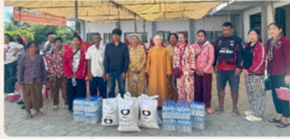
(左上圖)師父走進人群中，一起念佛 (右上圖)師父為壇場灑淨，祈願災難遠離，大眾吉祥如意 ▲戰區逃難的民眾也來到現場，希望師父能給予他們物資，但因為數量不夠，師父很慈悲地先給他們現有的，並且隔天再專程送物資過去給他們