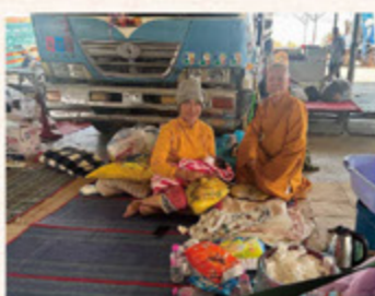
剛出生的小嬰兒就被母親帶著逃難