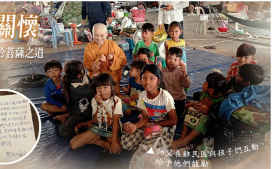
▲師父在難民區與孩子們互動給予他們鼓勵