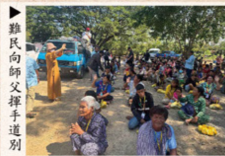
難民向師父揮手道別

此次柬埔寨福慧關懷行程，行腳遍及多個偏遠地區與難民聚集地，師父不辭辛勞，以實際行動落實佛法精神，長年如一日地付出，為當地人民帶來溫飽與希望，也讓我們深刻體會到珍惜當下、感恩擁有的重要。師父非常感恩，也讚嘆所有會員及發心者的護持，因為有大家的善心，師父才能夠代替大家將這些關懷傳遞出去。師父經常開示我們：「我們的生命有盡，色身會滅，但意識不會滅。我們每天的身口意都在造作，只是看是造善或造惡，應該要把握當下盡量去修，去做，因為只有我們實地去修，去做，才是真正自己所得。」