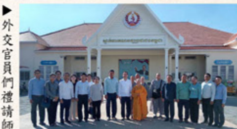
▲外交官員們禮請師父與他們一同合照